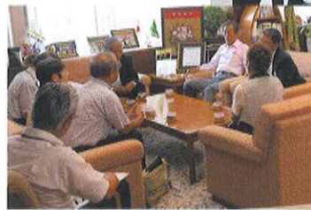
▼市長に支援の継続要請をおこなう