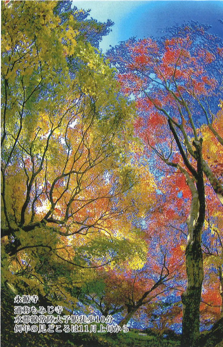
永源寺 通称もみじ寺 水郡線常陸大子駅徒歩10分 例年の見どころは11月上旬から

公益社団法人 松戸市シルバー人材センター 〒271-0043 松戸市旭町1-174 TEL 047(330)5005 FAX 047(330)5008 松戸市シルバー人材センター ホームページ https://webc.sjc.ne.jp/matsudo/ E-mail matsudo1@sjc.ne.jp 2019年(令和元年)9月1日