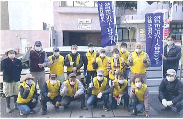
第3回花植え作業に参加の皆さん (令和3年11月24日)

第2回花植え作業が令和3年9月6日(月)、第3回花植え作業が同年11月24日(水)、イトーヨーカドー八柱店前県道沿い歩道でそれぞれ多くの会員の皆さんが参加して実施されました。第3回の花植え作業では、チューリップ、葉牡丹、パンジーの植え付けを行いました。