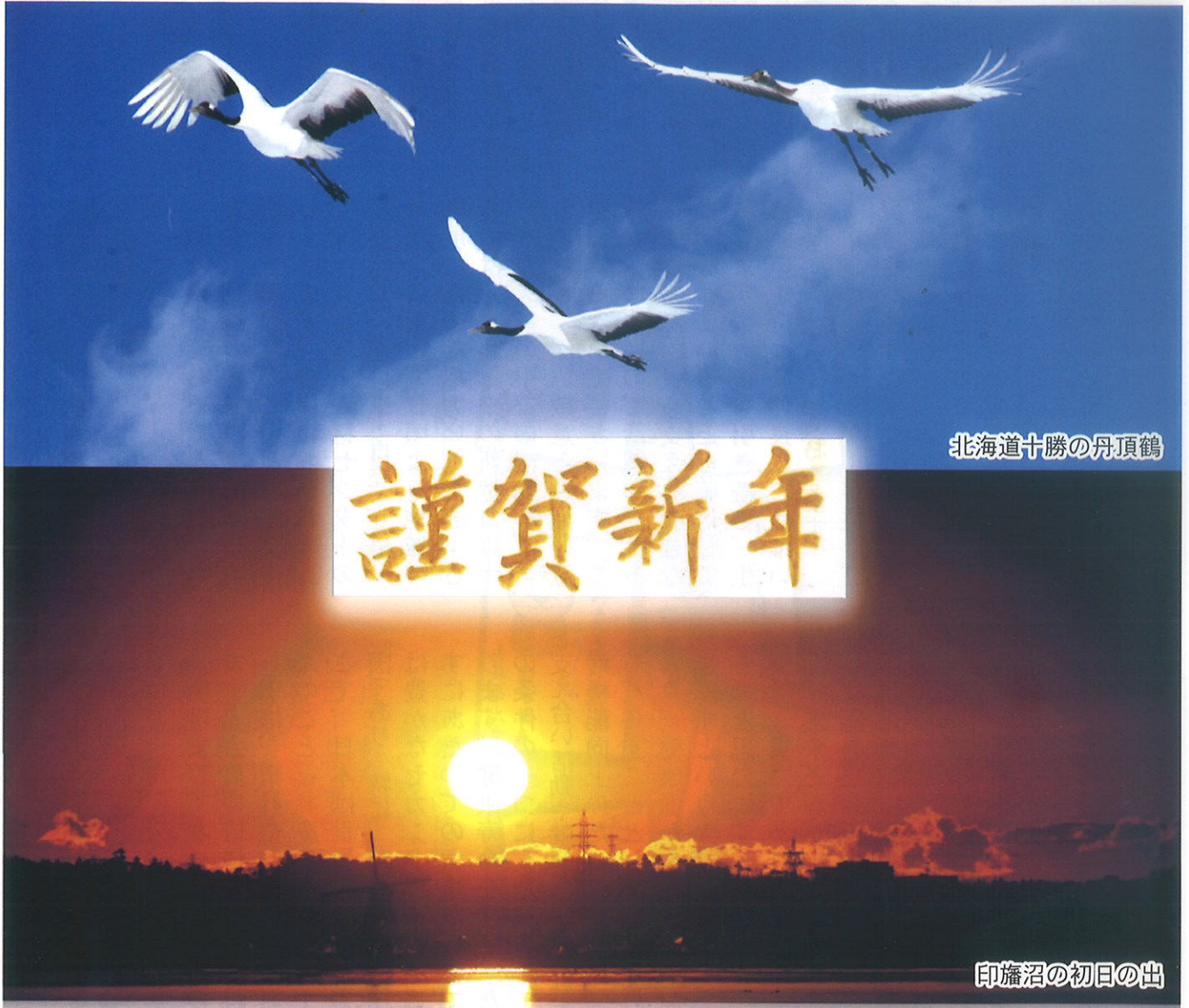
北海道十勝の丹頂鶴

公益社団法人 松戸市シルバー人材センター 〒271-0043 松戸市旭町1-174 TEL 047(330)5005 FAX 047(330)5008 松戸市シルバー人材センター ホームページ https://webc.sjc.ne.jp/matsudo/ E-mail matsudo1@sjc.ne.jp 発行 令和4年1月1日