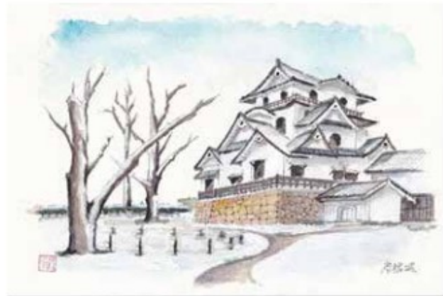
展示作品 左から「姫路城」、「雪景色の彦根城」