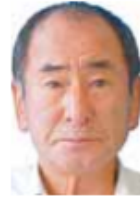
北小金駅北口 第2駐輪場