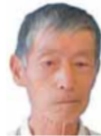
新松戸駅西口 第8駐輪場

ホテル、マンション等の再生に関する訴訟を手掛け、多くの建物を再生させた。弁護士協会で講演もしたというから手腕は半端では