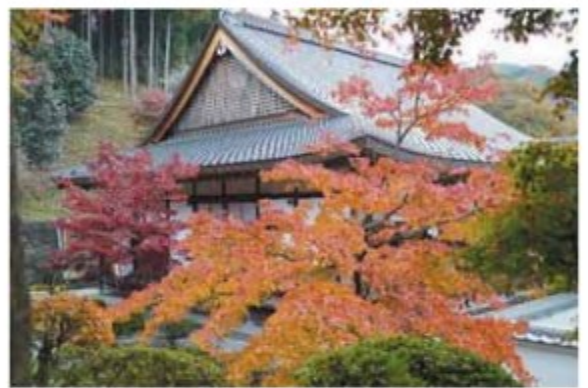
埼玉平林寺の紅葉