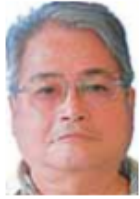
北小金駅南口 第1駐輪場