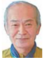
新松戸駅西口 第7駐輪場