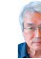
馬橋駅東口 高架下駐輪場