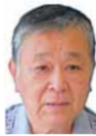
新松戸駅西口 高架下第2駐輪場