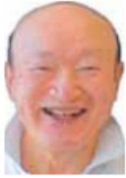
新松戸駅東口 駐輪場