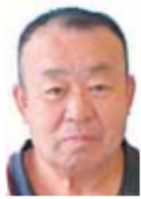
馬橋駅西口 高架下駐輪場