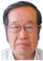
新松戸駅西口 高架下第3駐輪場