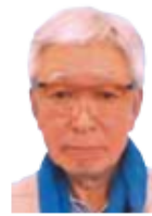
新松戸駅西口 高架下第1駐輪場