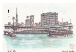
「両国橋」 近藤賢一(会員No.7624)画