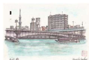
「両国橋」 近藤賢一(会員No.7624)画