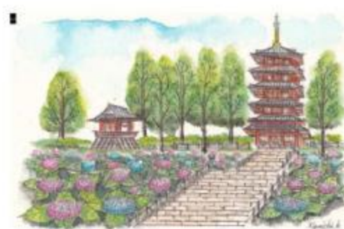
「本土寺」近藤賢一(会員No.7624)画