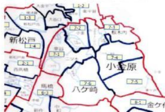
第7班地区割地図 7-1班~7-6