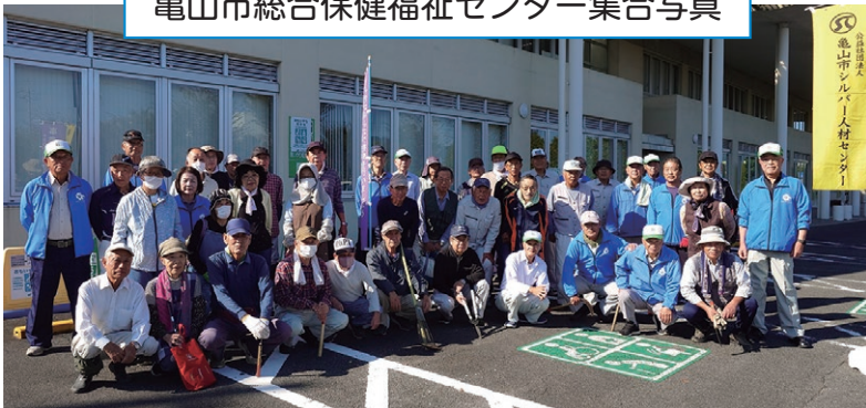
亀山市総合保健福祉センター集合写真