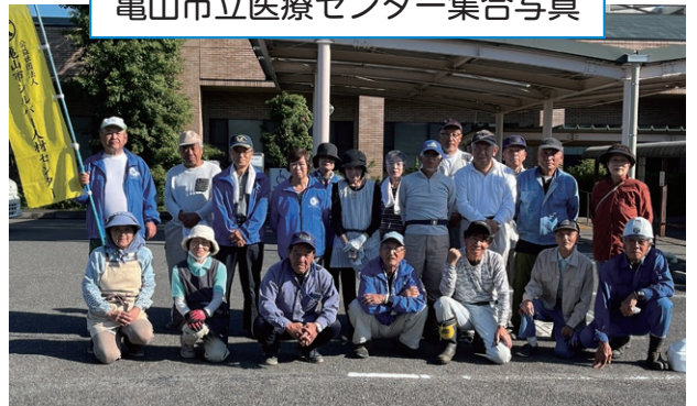
亀山市立医療センター集合写真