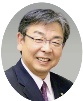
亀山市長 櫻井 義之