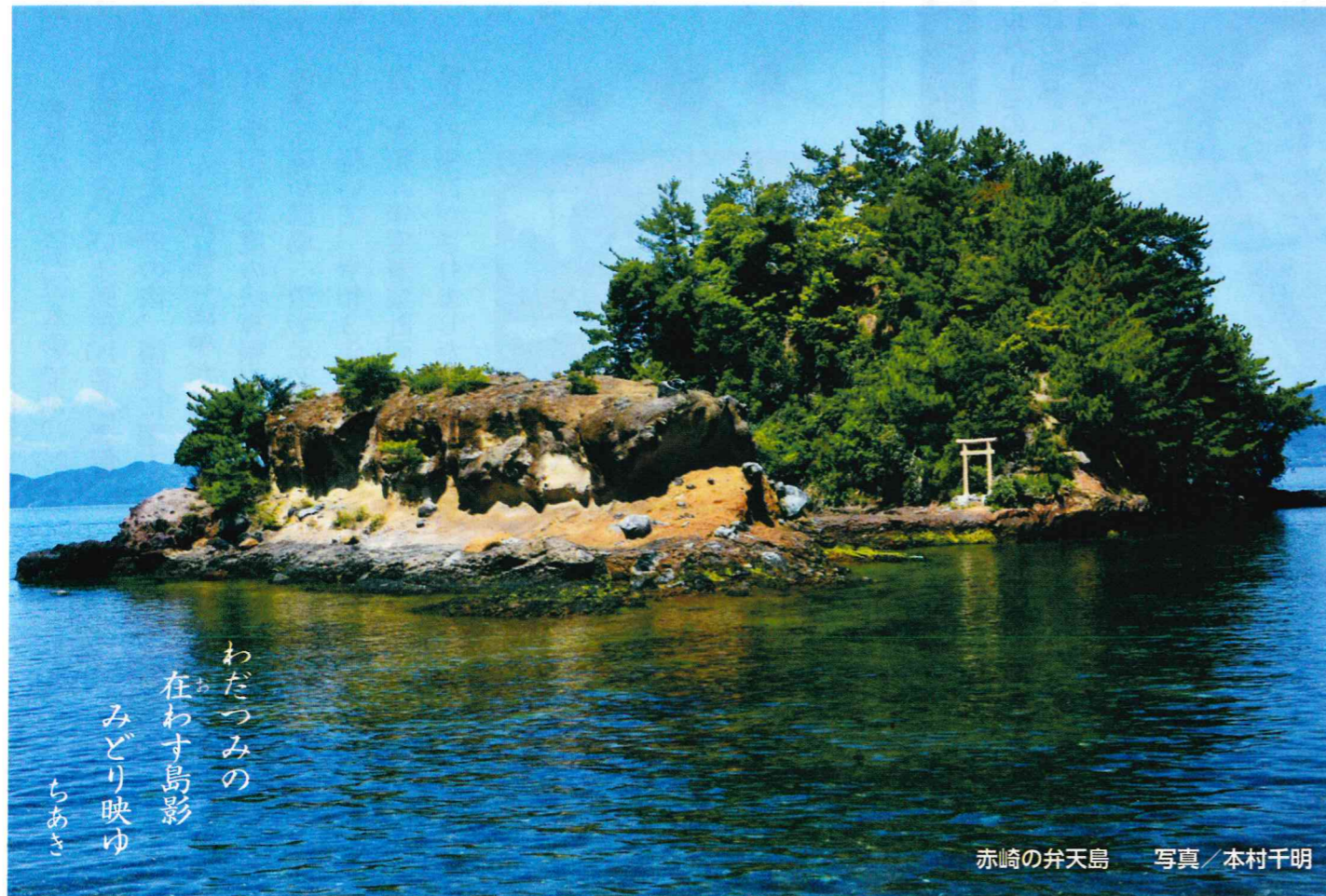
わたつみの 在わす島影 みどり映ゆ ちあき

公益社団法人 水俣・津奈木シルバー人材センター 水俣市築地9番38号 TEL.0966-62-1122 編集:組織広報委員会