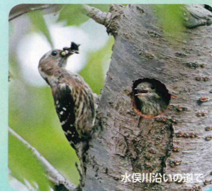
水俣川沿いの道で