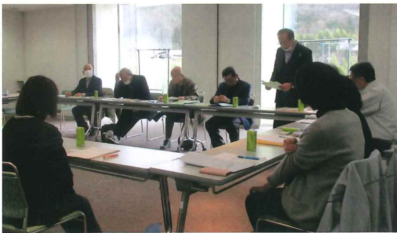
亀岡市シルバー人材センター視察

健全な財政状況維持のため会員の理解のもと、配分金の1%相当分を徴収し、先を見据えての健全運営を考えていました。