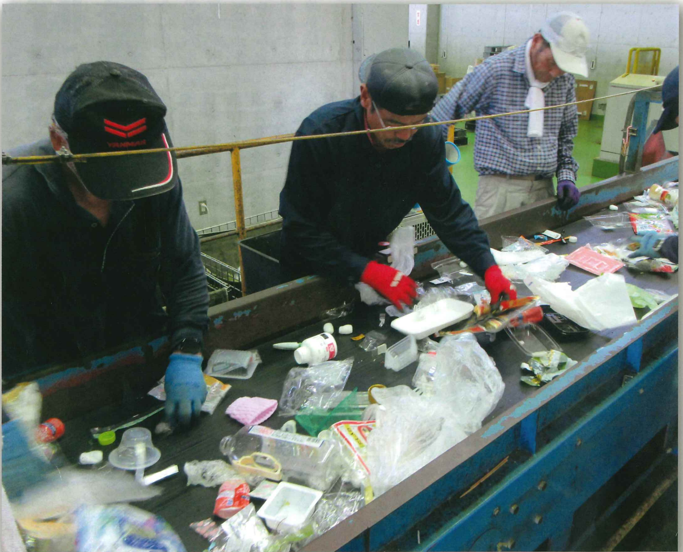
南あわじ市中央リサイクルセンター