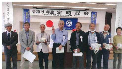
永年在職会員表彰者

なお、県のシルバー人材センターの15年・20年・25年の会員表彰は年間就業日数の規定を設けています。