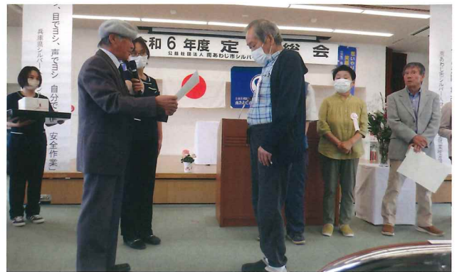
永年在職会員表彰式