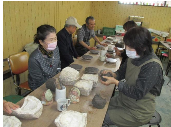
狸づくり、手ひねりなど