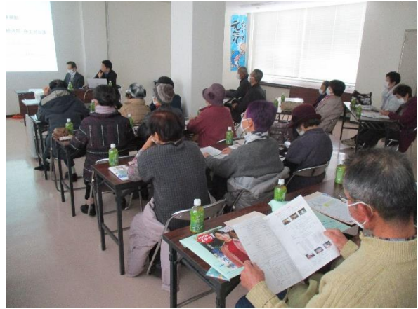
◆甲賀市シルバー人材センターでの研修◆