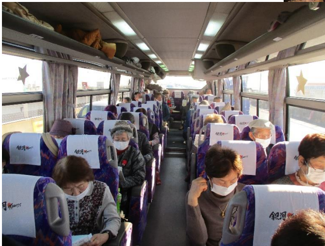
※当日は新型コロナウイルスの感染 予防のため、皆さんがマスク着用