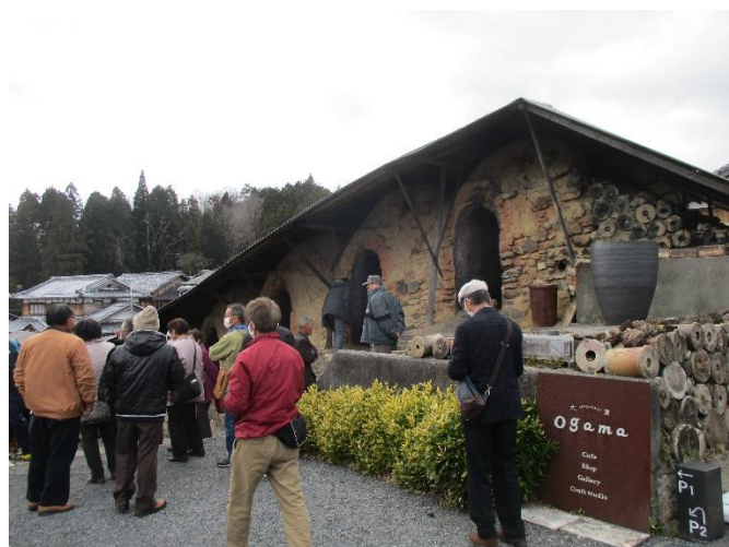
◆信楽焼の窯元めぐり◆（町並み散策）