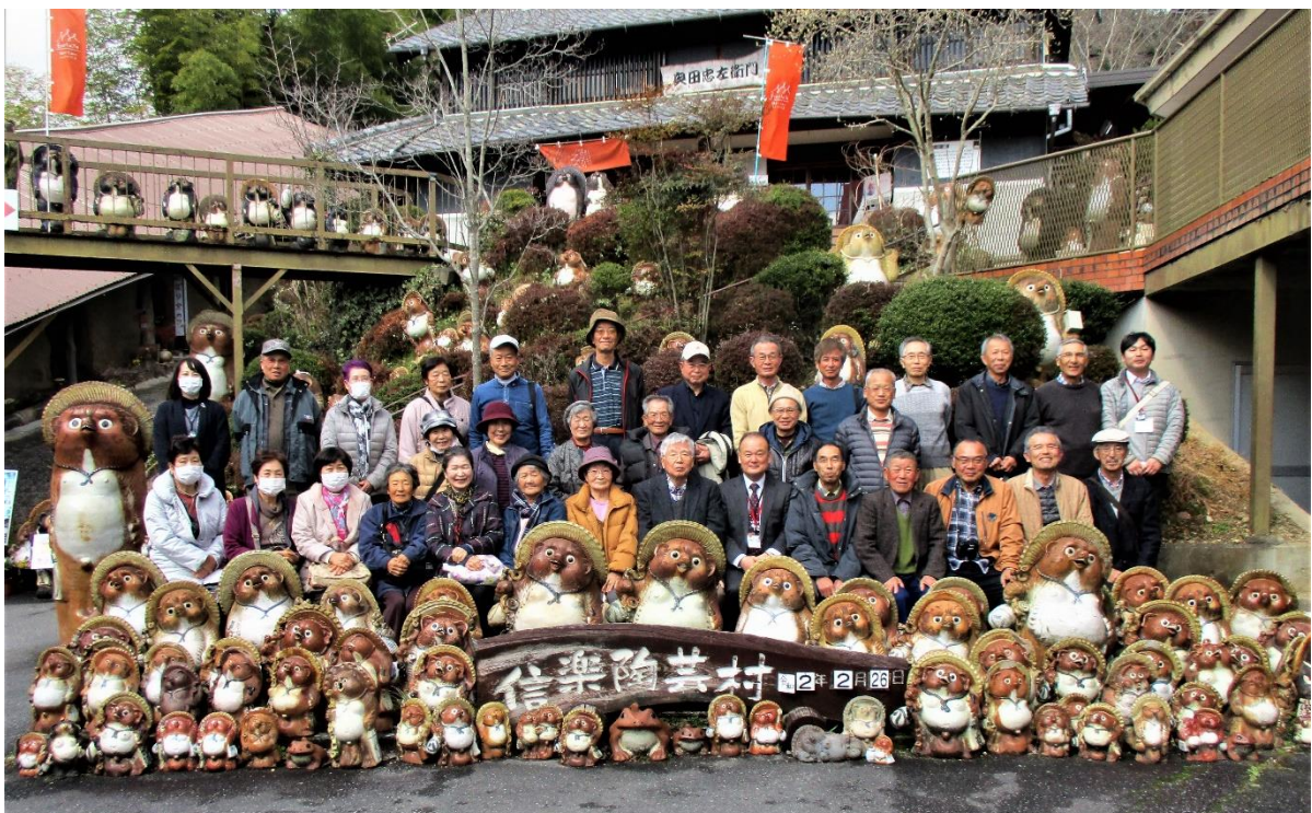
参加記念写真No.2 (信楽陶芸村)