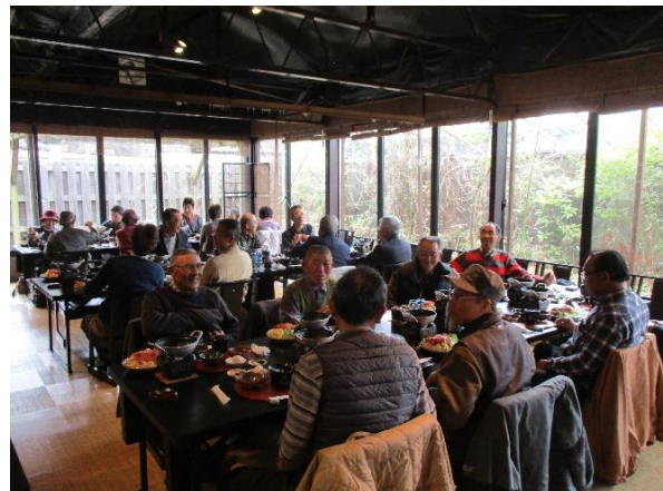
信楽駅前“一水庵”での近江牛のすき鍋セット (昼食会)