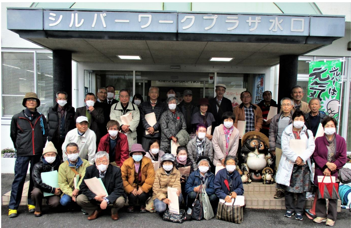
参加記念写真No. 1 (甲賀市シルバー人材センター)