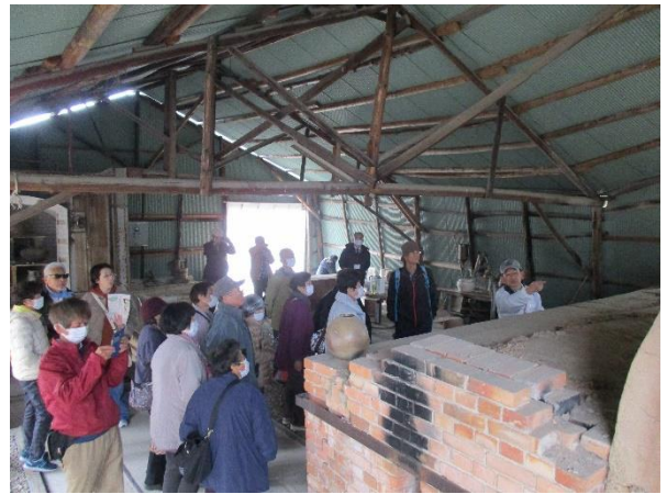
登り窯の説明を受ける会員