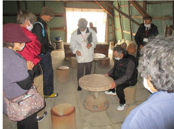
ろくろに関心を寄せる会員