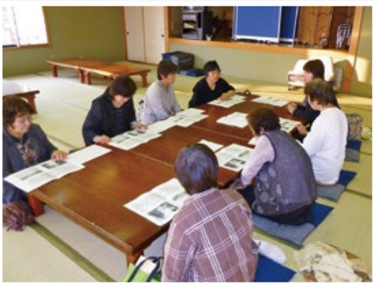
▲河野道の駅 就業会員ミーティング

就業中の「ヒヤリ・ハット」体験や、使用する用具のこと、会員相互の意見交換や事務局からの連絡事項など、これからもきめ細やかな対応で会員・事務局が一体となって「元氣よく」「仲よく」「楽しく」就業ができるよう工夫いたします。