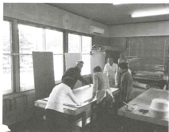
襖・障子張替講習会