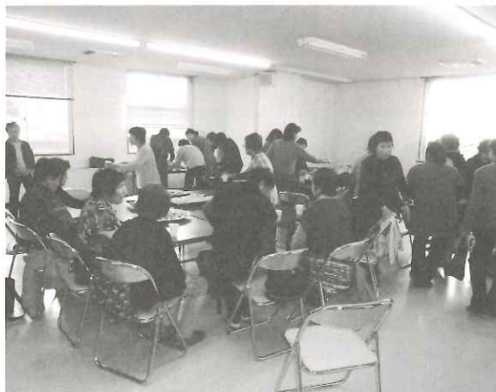
お茶を楽しむ参加者