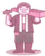
補修的な大工・ペンキ塗