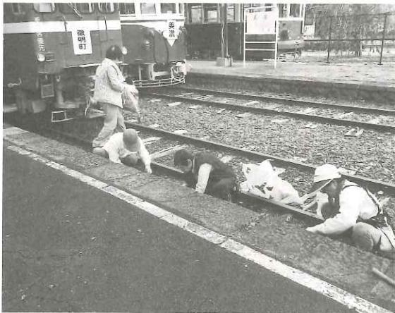
旧名鉄美濃駅の草引き

今回は会員約50名が日頃お世話になっている町内の旧名鉄美濃駅と広岡町公園の草引き、草刈、落ち葉の掃除などを行いました。