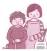
家事援助 (屋内外の掃除、お手伝い等)