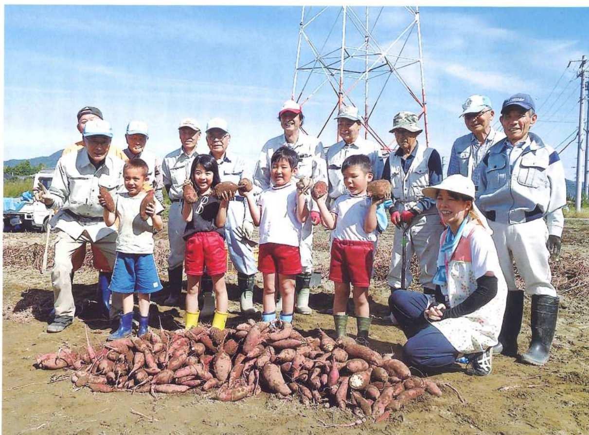
下牧こども園ぞう組のみんなとシルバー会員