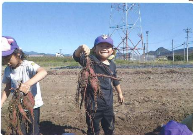
美濃ふたばこども園