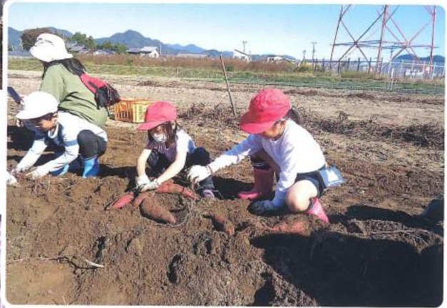
中有知小学校1年生