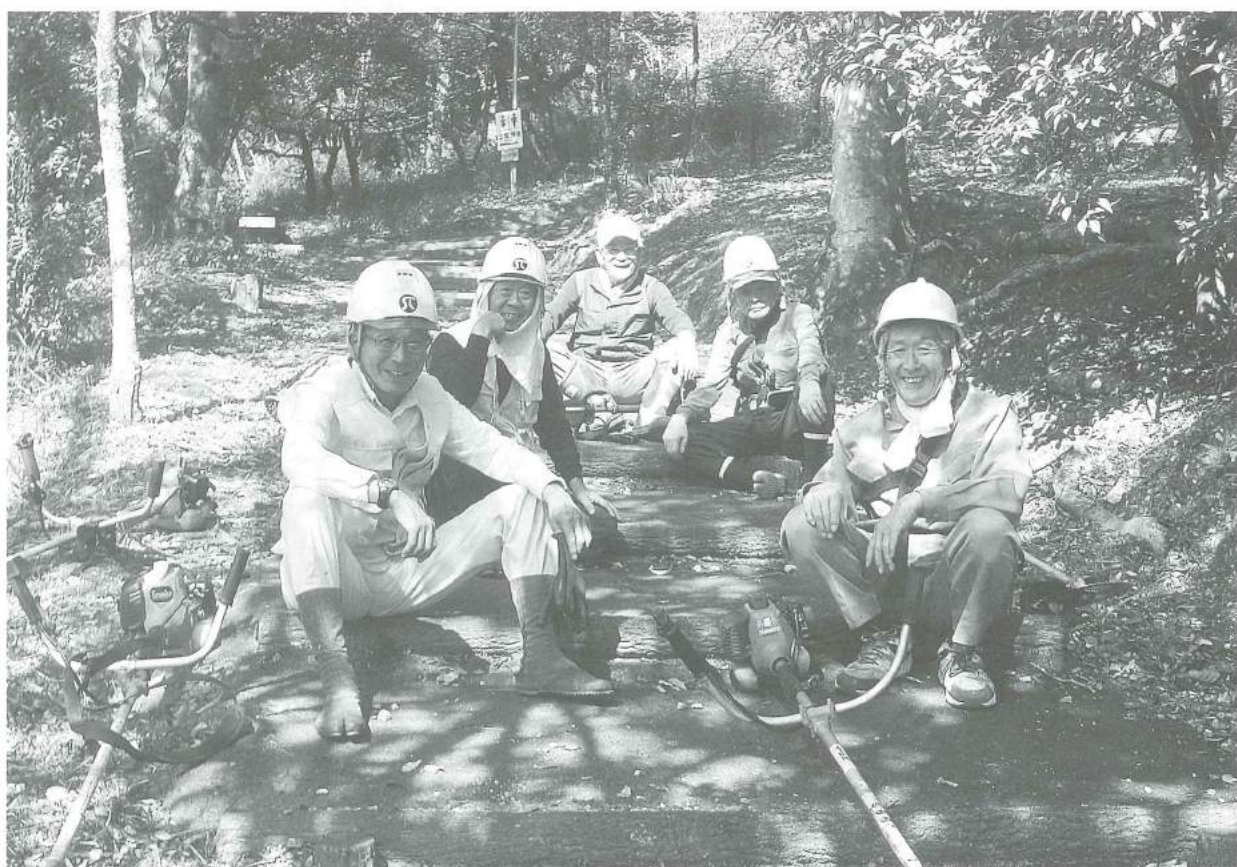
シルバーの日「ボランティア活動」ご苦労さまでした

発行所 〒501-3729 美濃市1571番地の3 公益社団法人 美濃市シルバー人材センター ☎ <0575> 33-2526