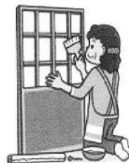
障子・網戸・襖の張替