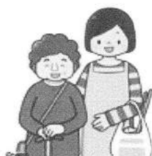
家事援助サービス