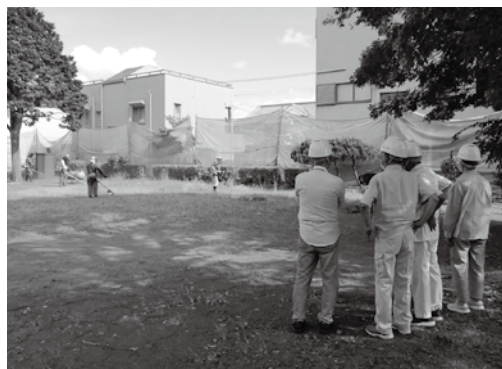
安全委員会 現場視察の様子

今年度も物損、傷害事故が発生しています。リスク管理・体調管理などを十分に行い、無事故200日を目指して安全に就業できるように注意しましょう。