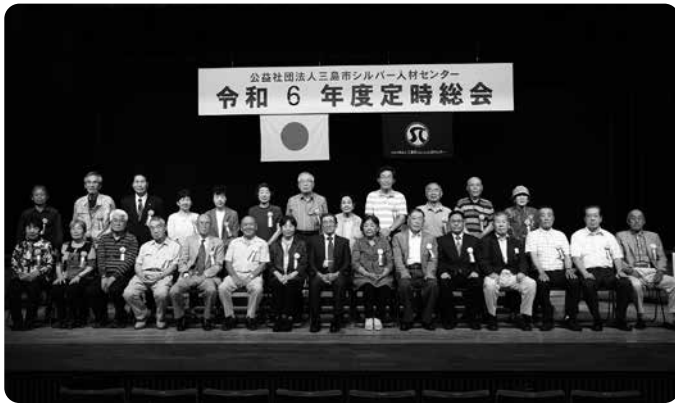
令和6年度表彰・喜寿のお祝いを受けられた方々

今後も健康に留意しながら、精進して参りたいと存じますので、更なるご指導、ご鞭撻を賜