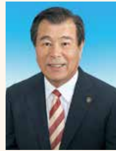
三島市長 豊岡 武士