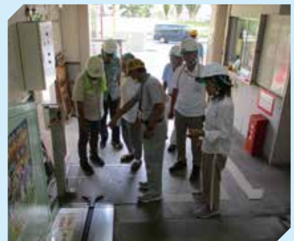
▲ 9月 安全視察の様子