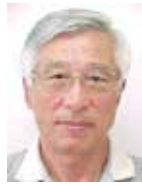
北上第二地区 松本 白

満72才を迎えても心身共に健康で働く希求を持ち続けており、これまでの仕事以外の新たな業種に挑戦したい意欲と好奇心に溢れている自分が不思議である。そして、スポーツと自己啓発に勤しみながら一生チャレンジャーとして後期青春時代を歩み続けたい。