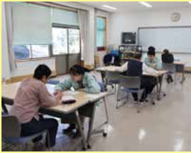
職員がマンツーマンでサポートします！

8月21日(水)と10月10日(木)の2日間、smile to smileの登録サポート講習会を開催しました。合計30名が参加し、現在の登録者数は443名で約67%の会員が登録しています。今後、配分金明細、お仕事紹介、事務局からのお知らせ等smile to smile配信に切り替えさせていただきます。まだ登録が済んでいない会員は登録をお願い致します。登録の仕方が分からない方は事務局にご相談ください。(スマホ、タブレット、パソコンを持っていない方を除く)