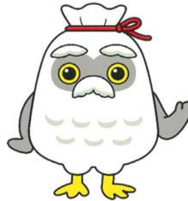
シルバー人材センター 「マスコットキャラ」 チエブクロー