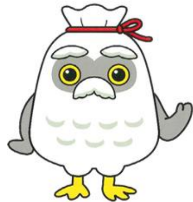
シルバー人材センター 「マスコットキャラ」 チエブクロー

公的施設就業は「公益社団法人水戸市シルバー人材センター就業期限の設定に関する基準」により、就業期限は 1 年とし、期限の更新は 3 年を限度とします。