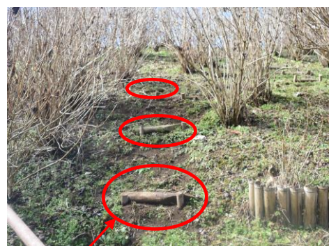
杭を差し込み小段を設置した

一方、保和苑では斜面での刈払い作業があり、心配しておりましたが、滑り止め用のスパイク靴を履いて作業をしていることを確認しました。また、水戸市公園協会から杭の提供を受け、斜面に杭を差し込み小段を設置し(写真参照)、滑りに対して十分に注意し、安全性を高めていることも確認できました。