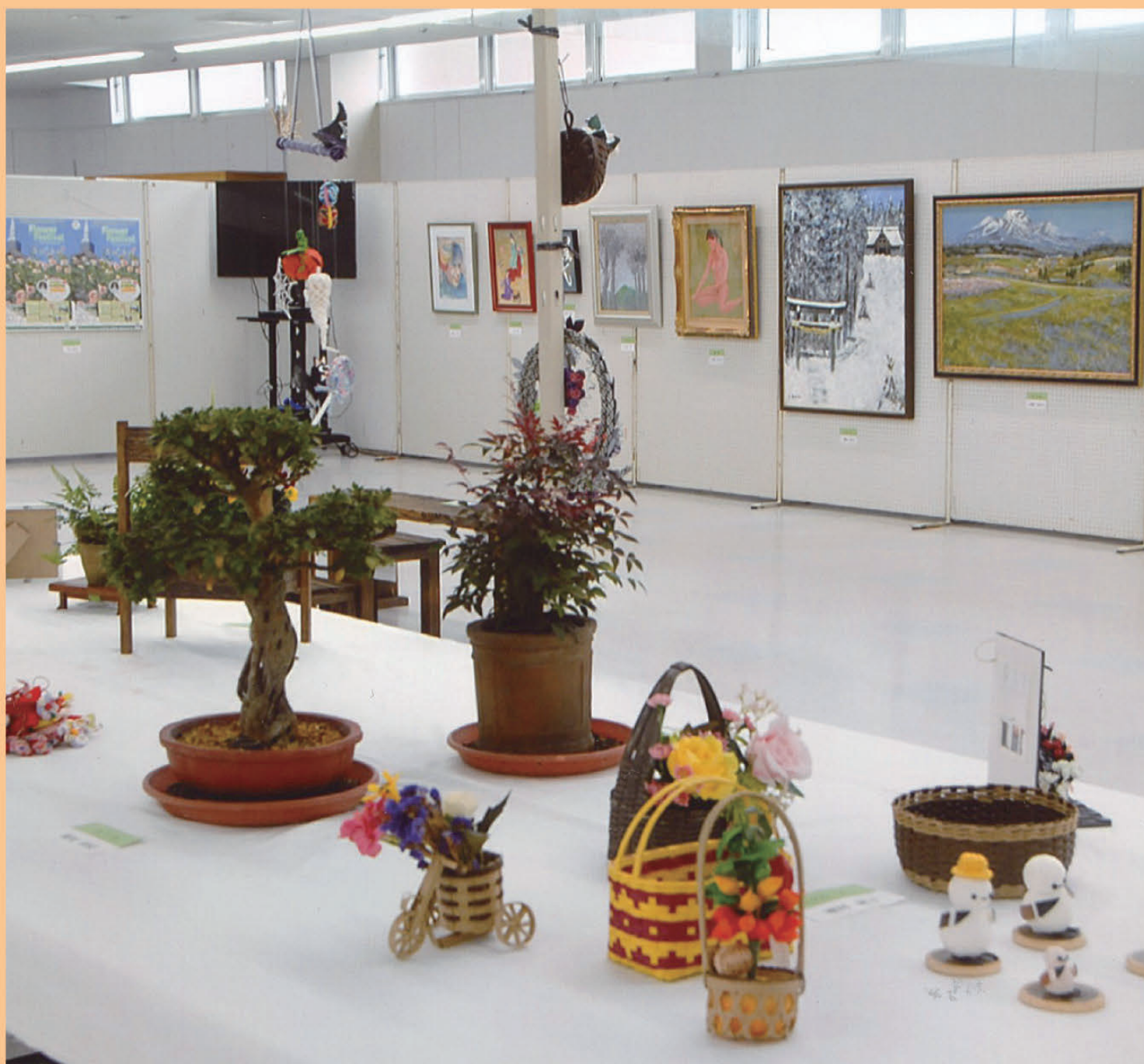
シルバーフェスタ作品展より