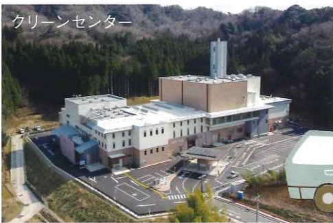
クリーンセンター

草刈りや庭木の剪定作業等で発生する残材（一般廃棄物）はクリーンセンター（須津）に搬入し処分しています。草刈りや庭木の剪定作業等で発生する残材（一般廃棄物）はクリーンセンター（須津）に搬入し処分しています。金は搬入時に精算することになっていました。従って、お客様（発注者）から料金をお預かりするか、会員が一時立て替えしなければなりませんでしたが、クリーンセンターと協議し、令和五年度からは後日に一括支払する「後納払い」とすることになりました。今後は、現金を持参することなく持ち込みができるよう改善しましたので利用しやすくなります。