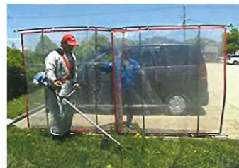
飛び石防護ネットの購入

令和五年二月十四日、機械除草班班長会議を開催し、令和五年度の班体制を確認しました。機械除草（機械による草刈り作業）は、例年受託件数約一、〇〇〇件、契約金額も約三、〇〇〇万円に近い実績となっており、主力業務の一つとなっています。