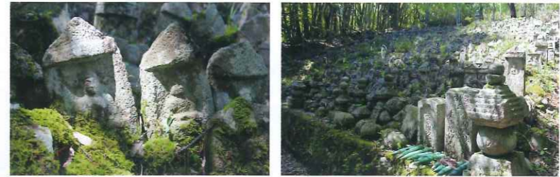
難波野の千駄地蔵

皆さんもご存じの「元伊勢」として名高い丹後国一宮「籠神社」（このじんじや）の奥宮「眞名井神社」（まないじんじや）南側一帯に「難波野」（なんばの）地区があります。その裏手の山肌を区切って多くのお地蔵さまが幾百となく並べられているところがあります。そこが「難波野の千駄地蔵」（なんばのせんたいじぞう）です。（写真下）