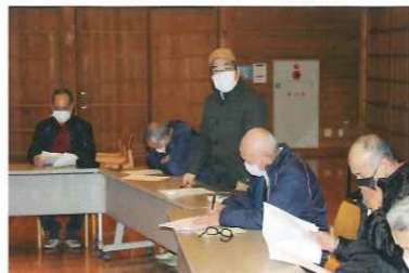
意見を受ける会員

令和五年一月から二月に、コロナ過で中止していました会員地区懇談会を、宮津市南部地域及び橋北地域、伊根町地域、与謝野町地域の4地域で三年ぶりに開催しました。会員数（令和四年十二月末現在）三五八名の内、三十％にあたる一〇八名が出席し、受付、司会、挨拶など地域班の役員が運営しました。懇談会では、事務局より会員数の状況、事業の実績、事故の発生状況、作業料金の改定、クリーンセンター処分料の後納払い、インボイス制度への対応などを報告、説明し、会員からは次のような意見や質問がありました。（会員数の推移は下表のとおりです。） ○事故が多い ○空き家対策 ○消費税とインボイス対応について ○全講習を実施してほしい。 意見を受ける会員 受付する会員と出席者