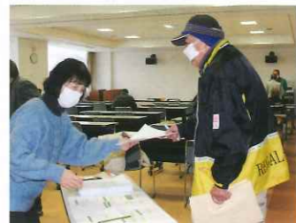
受付する会員と出席者