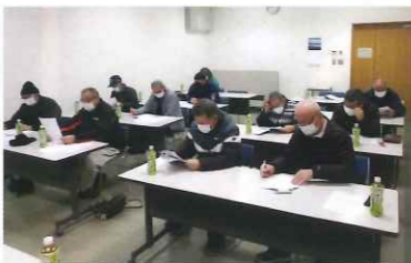
機械除草班・班長会議の様子

この日は、令和五年度の班体制を協議するため班長が出席。令和五年度も宮津六班、加悦・岩滝各一班、野田川三班、伊根二班の計十三班を編成し、七十六名（二月十四日現在の）の会員が作業を請う体制を確認しました。 また、草刈り作業では令和4年度に駐車中の車や人家のガラスなどを跳ねた小石で破損させる物損事故が5件も発生しており、その対策として「飛び石防護ネット」を新たに購入し、各班に配布して安全対策を強化することが確認されました。