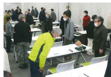
お辞儀の練習をする会員

令和五年二月二十四日、宮津シーサイドマートミッブルにおいて当センター会員を対象にビジネスマナー講習会を開催しました。センターの仕事では、お客様（発注者）や会員相互など、人に接する機会が多いため、あいさつはもちろん、言葉の使い方、相手の