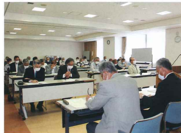
令和五年度定時総会の様子

事業報告では、令和四年度契約実績が請負・委任事業、派遣事業を合わせ一億六千九百九十二万円、昨年度より八百四十一万円の伸びとなり、新型コロナウイルスの影響で大きく落ち込んでいた契約実績から徐々に回復傾向にあることが報告されました。また、センターの基盤である会員数については、会員拡大キャンペーンを始めとした地道な入会運動が功を奏し、前年度末より五名増加し三百五十三名となり、六年ぶりに増加に転じたことが報告されました。