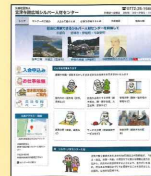
ホームページのトップ画面 https://webc.sjc.ne.jp/miyadu/

二月からセンターのホームページを全面リニューアルしました。宮津市、伊根町、与謝野町の広域シルバーである特徴を生かし、それぞれの代表的な素材をトップ画面に設けて、地域性のあるオリジナルなホームページに刷新しましたので、皆さん一度、アクセスしてみてください。