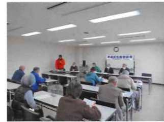
野田川わーくぱる