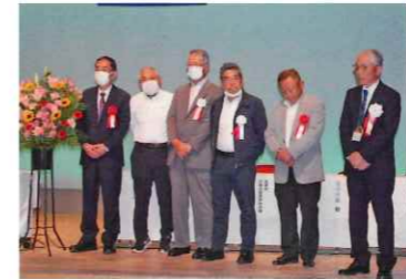
退任される役員の皆さん