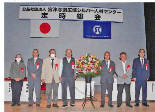
会員10年表彰、地域班長6年表彰、役員6年表彰の皆さん (欠席者除く)

契約金額は、一億五千七百二十七万円で、前年度比三百二十二万円の増、コロナ禍の影響を受け大きく落ち込んだ令和二年度からは約一千五百万円の回復となりました。