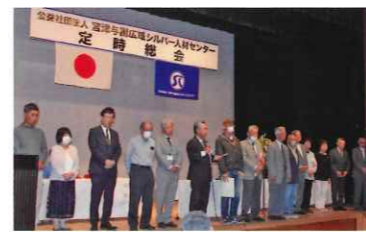
新しく選任された役員の皆さん