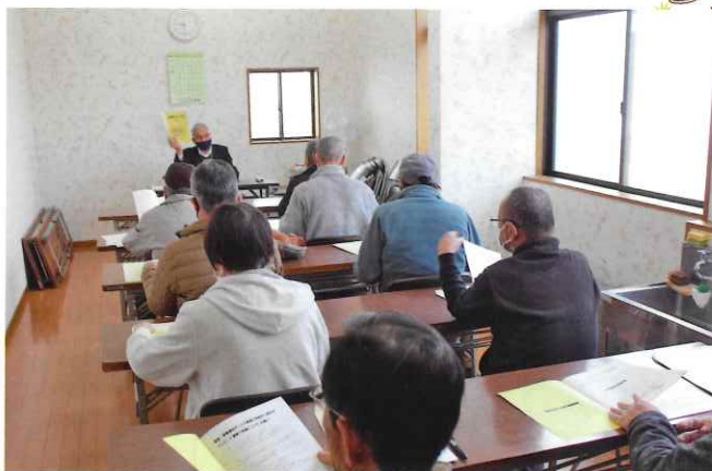
3月19日に行われた入会説明会の様子 この日は9名が出席、8名の入会がありました。