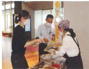
Café♡悠里 町役場での移動販売

びデイサービスセンター宮前荘に、介護補助者講習や実習を経た会員が、交代で毎日一人ずつ4時間、派遣会員として居室や廊下の清掃、寝具の交換、食器洗いなどの業務を担当しています。施設側の評判も上々で介護人材不足のおり、大変感謝されています。今後は、モデル事業の結果を検証し派遣する事業所を増やすことができればと考えております。 これら二つの取組みにより課題だった会員と就業機会の拡大、特に女性会員が活躍できる場を開拓することができ、さらに労働力不足解消にも貢献できたと思えます。 このように新規事業を短期間で実現することができたのは、町当局をはじめ関係機関の皆様