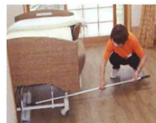
特別養護老人ホームでの介護補助者派遣事業

6月頃からカフェの再開を待ち望む温かい声が寄せられ、当センターとしても再開に向けて感染症拡大防止策を講じ、7月下旬から再開することができました。現在は提供するメニュー