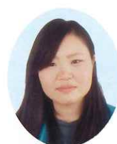
公益社団法人 角田市シルバー人材センター

色麻町SCはまだまだ土台づくりの最中です。会員さん・発注者さんに迷惑をかけながら、そして近隣SCの先輩業務係様方に教えを請いながら、なんとか業務をこなしています。今後ともよろしくお願いします。