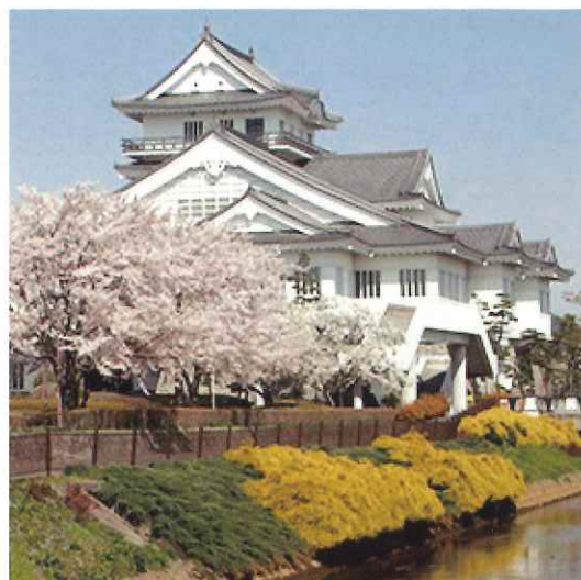
Café♡悠里のある巨理町悠里館

まず、一つ目は、昨年10月に巨理町立図書館2階に集いの場、ふれあいサロン「Café♡悠里」を開設しました。ここでは、飲食の提供や会員