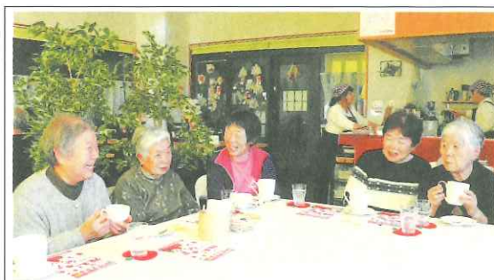
コーヒーを飲みながら楽しく会話する利用者ら

のご協力とご支援並びに会員皆様のご努力の賜物と感謝申し上げます。 また、新型コロナウイルス感染症が拡大しているなか、シルバー事業に及ぼす影響を注視しつつ、感染拡大の防止等に適切に対応しながら、会員が安心して就業できるようにこれからも全力でサポートしていく所存です。