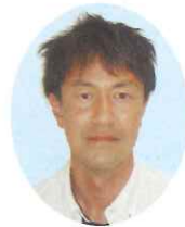
一般社団法人 色麻町シルバー人材センター