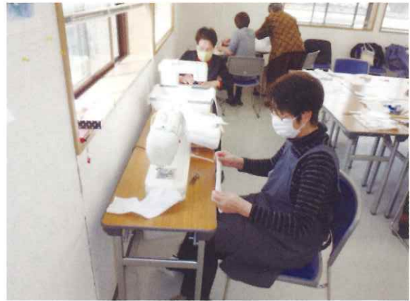
マスクを製作している 岩沼市シルバー人材センターの会員