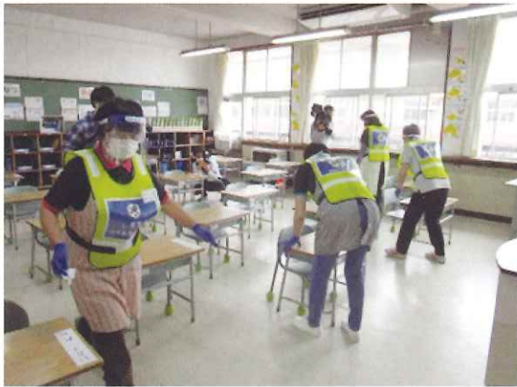
ウイルスバスター隊の活躍 塩釜市シルバー人材センター

未曾有の事態となった今こそ、課題やリスクを的確に分析し、どのように対策を講ずるべきかを検討する良い機会ととらえ、今後に備えていきましょう。