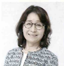
公益社団法人 宮城県シルバー人材センター連合会