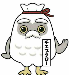
シルバーイメージキャラクター「チエプロー」