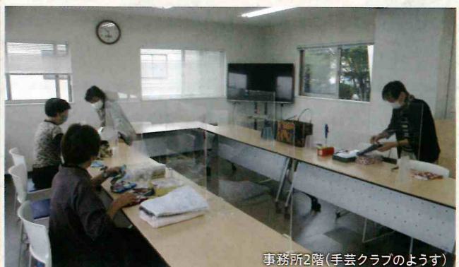
事務所2階(手芸クラブのようす)