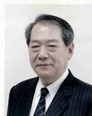
公益社団法人 宮城県シルバー人材センター連合会