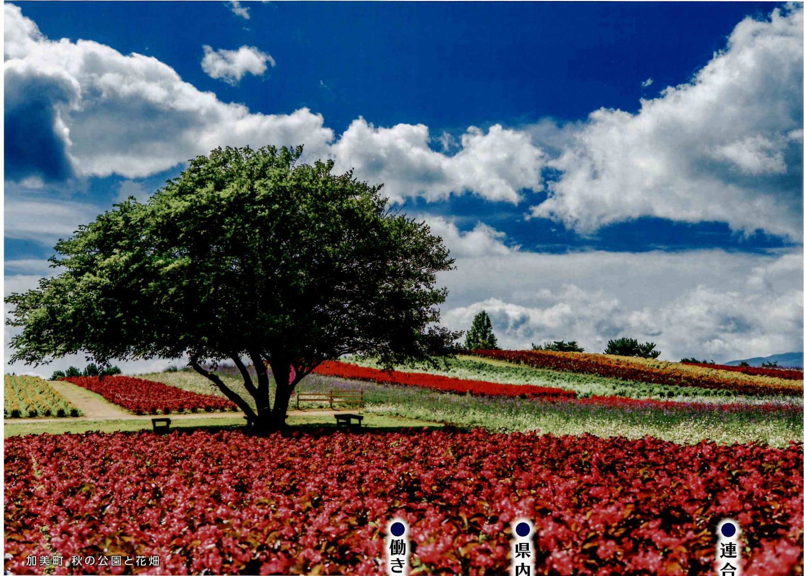
加美町 秋の公園と花畑