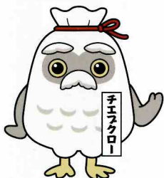
シルバーイメージキャラクター 「チエブクロ」