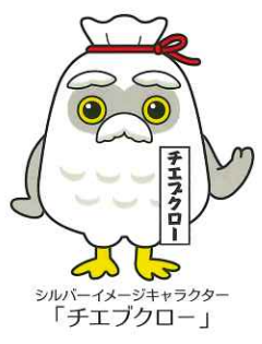
シルバーイメージキャラクター「チエブクロー」