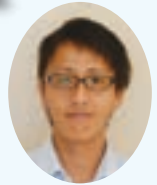
一般社団法人 大和町シルバー人材センター