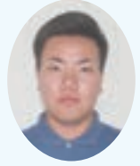
公益社団法人 登米市シルバー人材センター