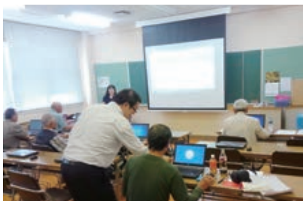
パソコン入門技能講習（大崎市会場）