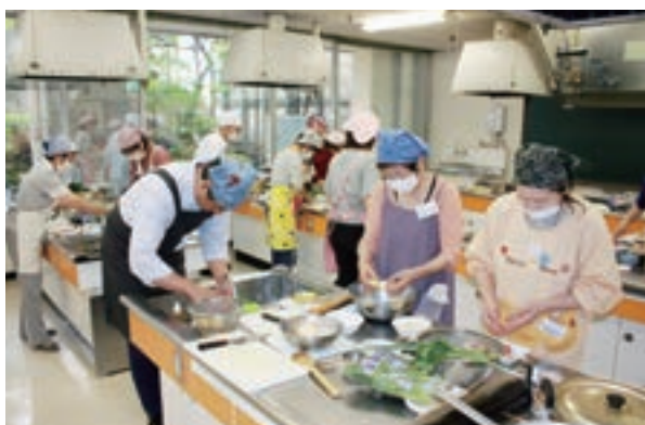
調理・介護食スタッフセミナー（仙台市会場）