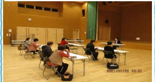
真剣に受講する提供会員さん

1月22日(金) 保育士さんによる「保育の心、他」・保健師さんによる「小児看護の豆知識、他」の講習会を行いました。