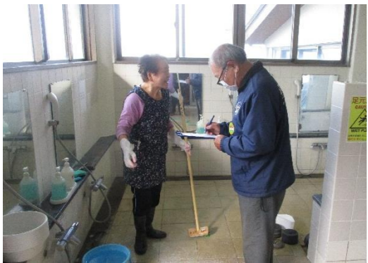
パトロールの様子/委員長による聞き取り ふるさとの湯

今回は清掃就業現場です。安全管理委員長が就業会員へチェックシートをもとに聞き取り調査及び施設内を巡回しました。服装・履物等を確認しました。清掃道具保管場所等は、しっかりと整理整頓されていました。濡れた床での転倒及び清掃道具でのつまずき転倒に十分注意するようにお願いしました。