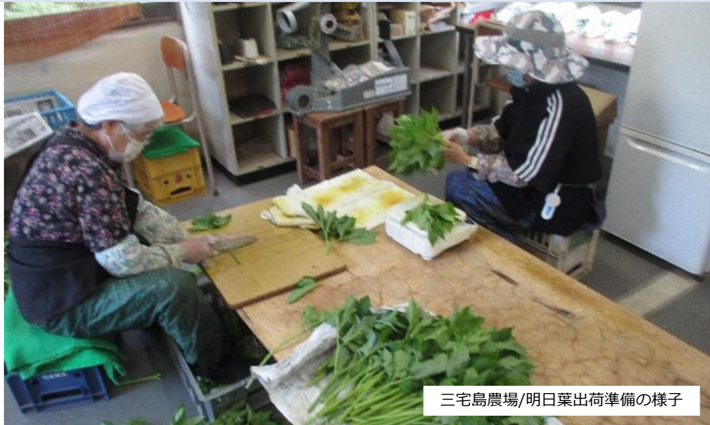
三宅島農場/明日葉出荷準備の様子