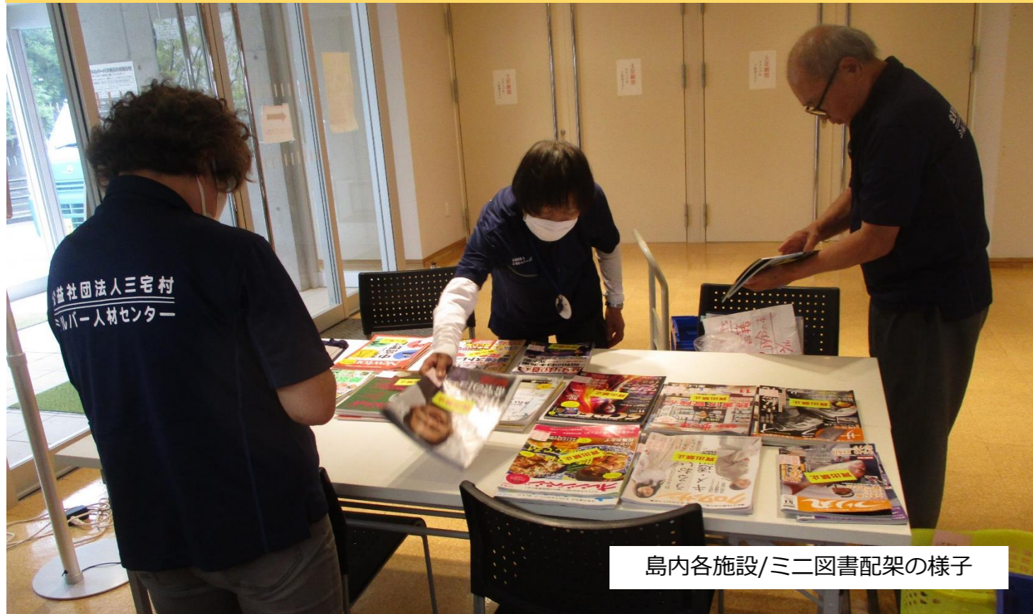
島内各施設/ミニ図書配架の様子