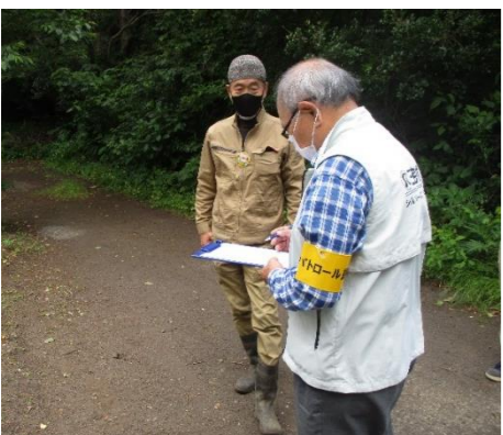
パトロールの様子/聞き取り調査 三宅島農場

作業時の服装の確認、棘取作業の様子、明日葉出荷作業の様子を確認しました。朝礼時リーダーから転倒注意、熱中症の注意などしっかり説明がされていました。また、毛虫発生時期のため、注意喚起を行いました。