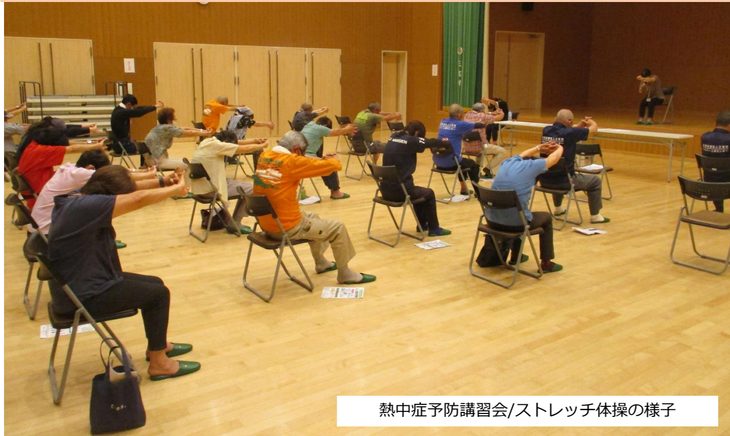
熱中症予防講習会/ストレッチ体操の様子