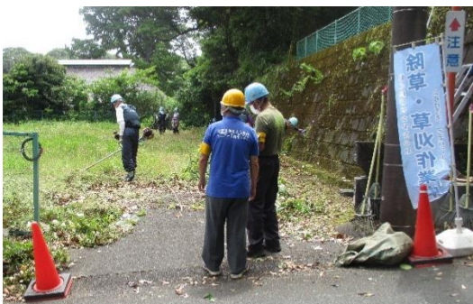
パトロールの様子/ 就業状況確認

作業間隔も確保され、道具の保管状況等も良好でした。こまめな休憩をお願いし、パトロールを終了しました。引き続き安全就業をよろしく願います。