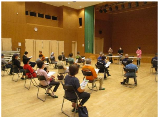
熱中症予防講習会の様子/ 三宅村文化会館 (リスタホール)

「熱中症の症状について」 「熱中症の予防方法について」 「予防法チェック表」などを教えていただきました。最後に運動能力維持のためのストレッチを行いました。