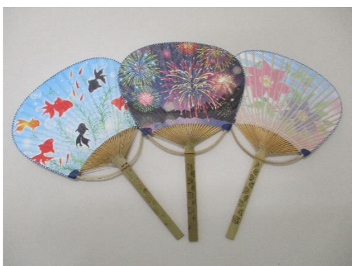
令和5年度うちわ/左から 金魚・花火・鉄線トンボ

7月29日(土)に開催される夏の風物詩「三宅島マリンスコア」21フェスティバル」でシルバー人材センター内輪を役職員が来場者の方々に配布します。