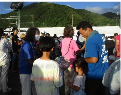
普及啓発活動(うちわ配布) / マリンスコレ会場

7月29日(土)に開催された三宅島マリンスコレ21フェスティバルにおいて、普及啓発活動を実施しました。