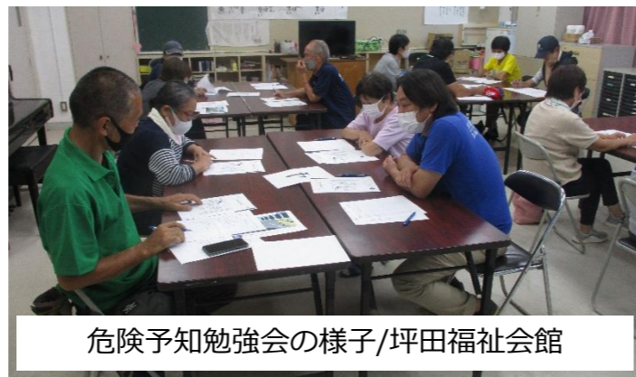
危険予知勉強会の様子/坪田福祉会館