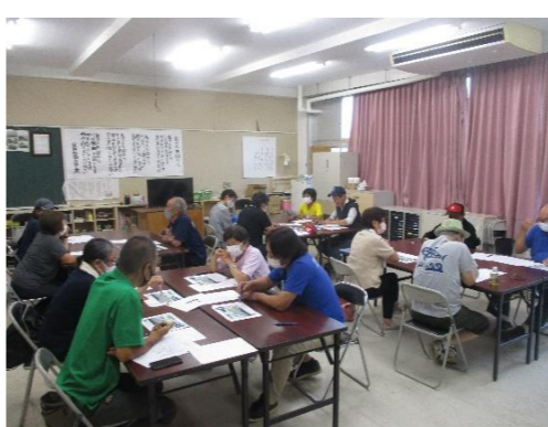
危険予知トレーニング勉強会の様子 / 坪田福祉会館

勉強会には、会員14名職員2名合計16名が参加しました。書面安全管理委員長の挨拶の後、4班に分かれ、イラストを見て危険のポイントとその対策を出し合い、各班が発表しました。各班より色々な視点で多くの意見が出され、発表の際には拍手が起こるなど、盛り上がりのある勉強会となりました。危険予知の重要性を認識し勉強会は終了しました。