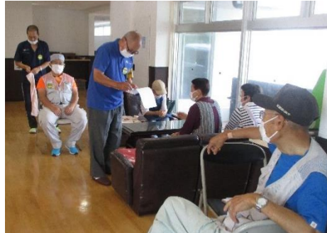
聞き取り調査の様子 / 伊豆避難施設(三宅島)

今回はワックス清掃就業の現場です。安全管理委員が就業会員への聞き取り調査及び作業状況を確認しました。施設入口の作業中看板設置、道具の保管状況等良好でした。作業中はコードに引っかからないように対策をしながら作業を進めていました。引き続き安全就業をよろしく願います。