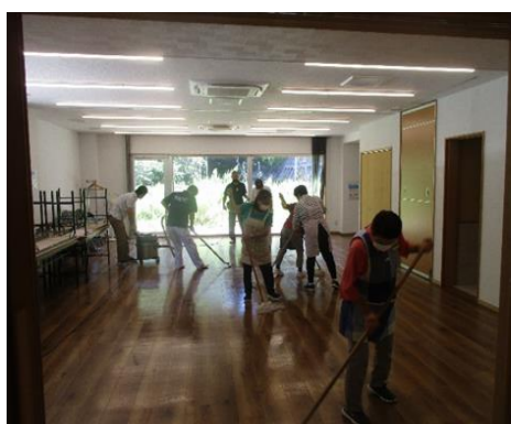
ワックス清掃作業の様子／三宅村斎場(三宅島)

リーダーを中心に手際よく、安全に注意しながら作業をしていました。引き続き安全就業をよろしくお願いいたします。