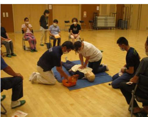
救命救急法及びAED講習会の様子／三宅村文化会館