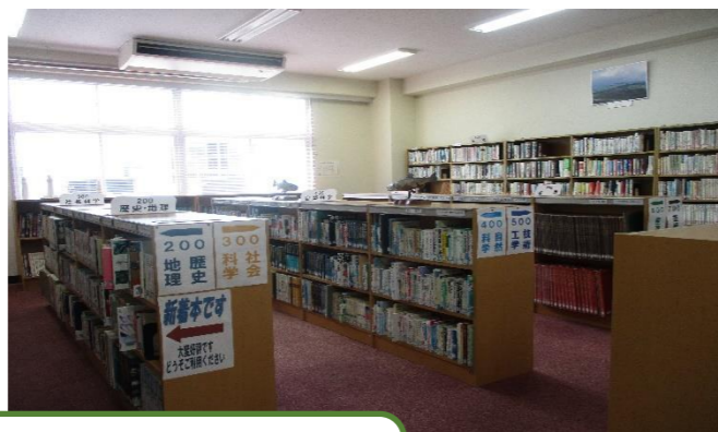
図書館・資料館の就業風景 本・雑誌も探しやすいように配置されています。