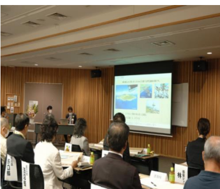
事例発表の様子/ 安全大会会場

「安全就業優良シルバーセンター」の表彰式の後、安全就業に関する事例として三宅村シルバー人材センターの取り組みを報告しました。安全就業ワッペン・空調服の導入や、熱中症や転倒予防など様々な講習会、危険予知トレーニングシートなどを紹介しました。他のセンターの取り組み事例なども知ることができたので、今後の安全就業に役立てていきます。