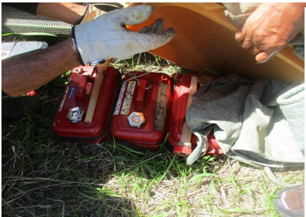
携行缶は日陰に置き、覆いもされていました。

安全管理委員が就業会員への聞き取り調査及び作業状況を確認しました。 リーダーを中心に手際よく安全に注意しながら作業が行われていましたが、刈払機使用者に注意喚起をしました。