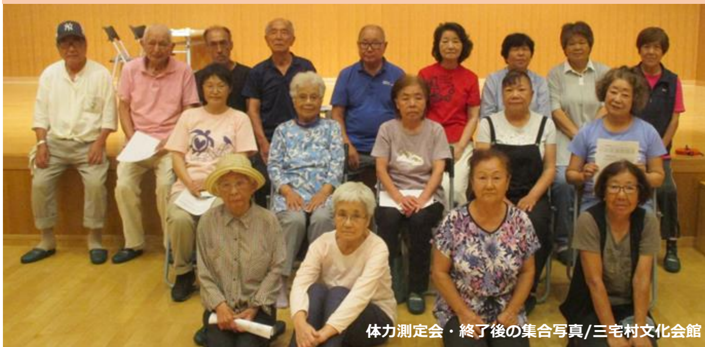
体力測定会・終了後の集合写真/三宅村文化会館