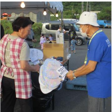
普及啓発活動(うちわ配布) / マリンスコーレ会場

当日は、気温・湿度共に高く、うだるような暑さでしたが、11名の役職員で、シルバー人材センターうちわとシルバードよりを、合計約500セット配布しました。会場の来場者と出店されている方に配布をしました。ご家族で柄違いを手に取り、竹製で素敵という声も聞かれました。配布が完了したときには、会場内の至る所で、多くの方がそのうちわで涼をとっていました。活動ありがとうございました。