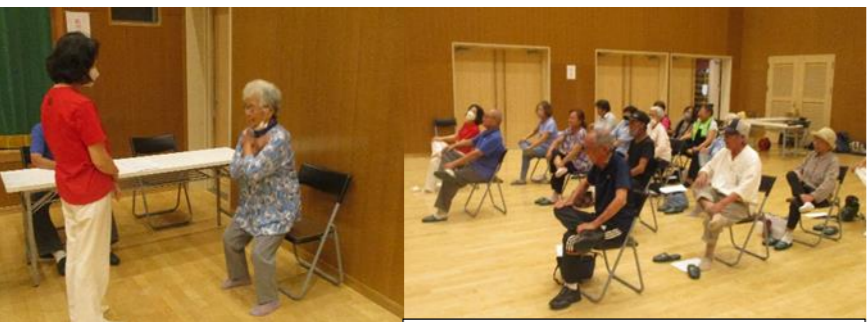
テストの前に全員でストレッチを実施。