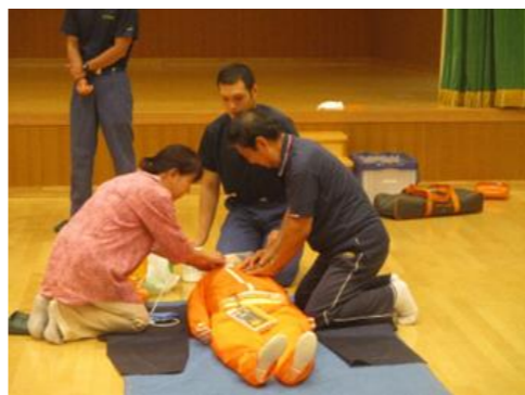
倒れた人にAEDを使用し、指示に従って心臓マッサージをしている様子。

その後、倒れている方に駆け寄り、AEDを使用するまでの一連の動きを実践しました。最後に乳幼児の心臓マッサージと異物を吐き出させる方法を教えて頂きました。 とつさの時に慌てず対応できるように、経験を積み重ねていくことが大切だと思われれます。