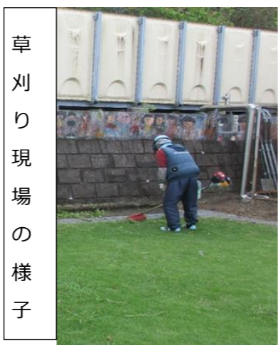
草刈り現場の様子

・女性会員の平均年齢が1歳以上高くなっている。女性会員の新規確保の対策が必要 ・交通安全講習会の実技で、警察の方が同乗しての実施はとても良い試み。センターの車を運転する会員は、全員講習会を受けることが望ましい。 ・作業別安全基準対策は、会員に周知が必要。 ・安全就業においては、会員一人の丈夫な体づくりが重要。 ・万が一事故が起こった場合は、再発防止として、センター広報誌(シルバーみやけ)で周知するとよい。 ※今回の巡回指導でいただいたご意見を活かし、今後も安全就業に努めていきたいと思います。