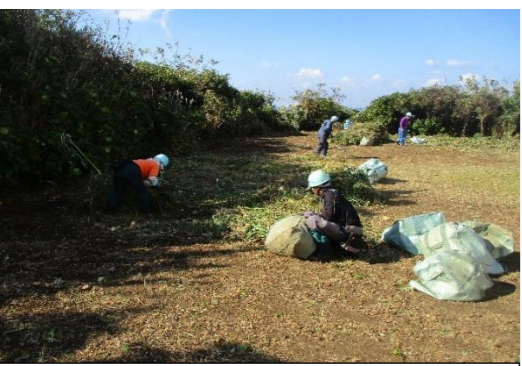
草刈り作業現場の様子