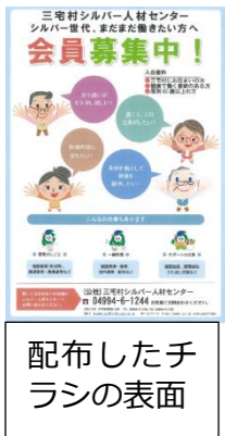
配布したチラシの表面

更に、農作物品評会には、会員の方々が三宅島農場で大事に育てた赤芽芋・明日葉・紅あずまを出展しました。