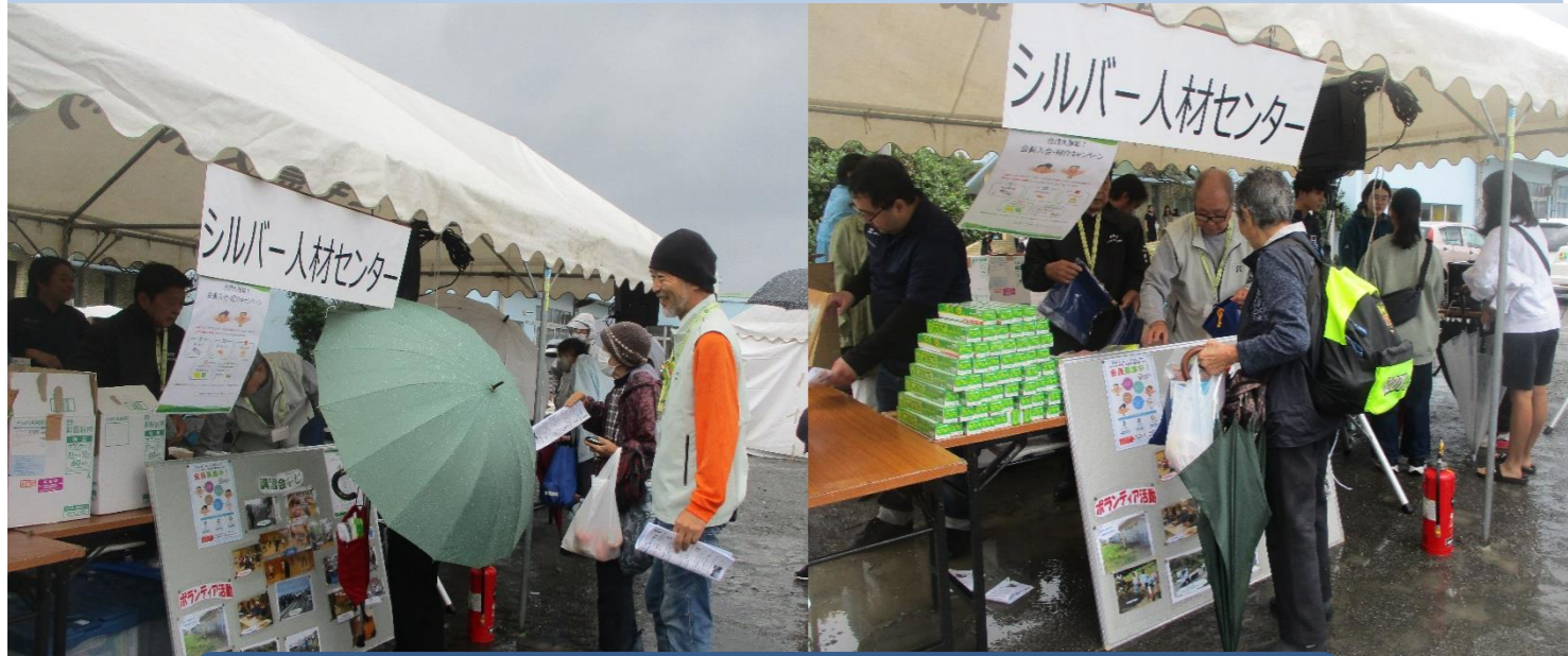
第25回三宅島産業祭での普及啓発活動