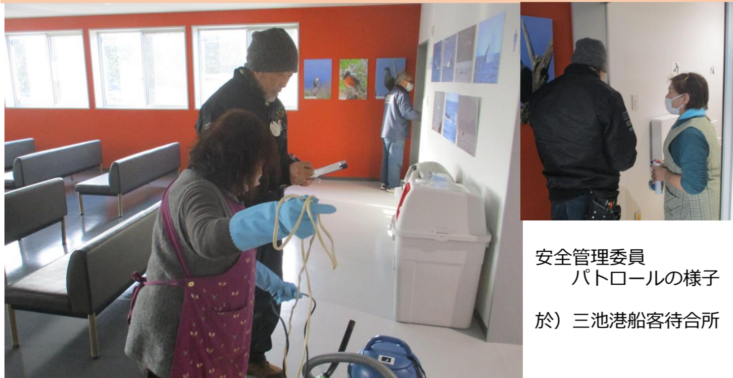
安全管理委員 パトロールの様子 於) 三池港船客待合所