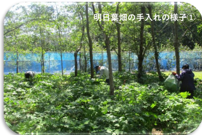
明日葉畑の手入れの様子①

さあやるぞ 将来の不安 なくすため 令和8年度三宅村シルバー人材センター安全就業標語応募作品より