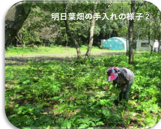
明日葉畑の手入れの様子②