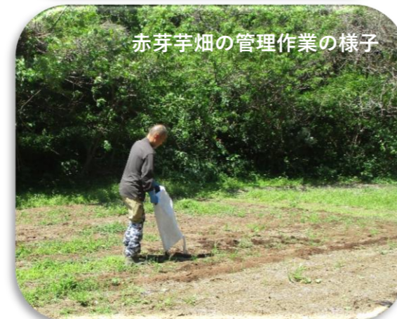
赤芽芋畑の管理作業の様子