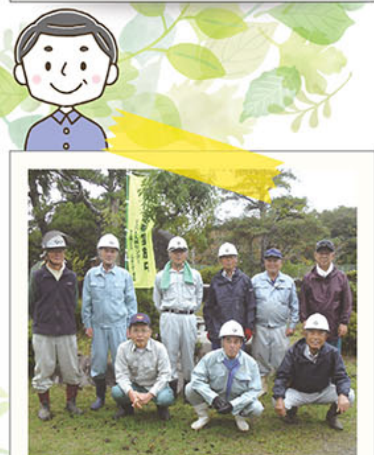
Silver day 2019.10.19 sat