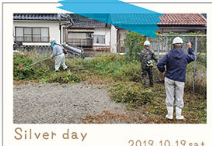
Silver day 2019.10.19 sat