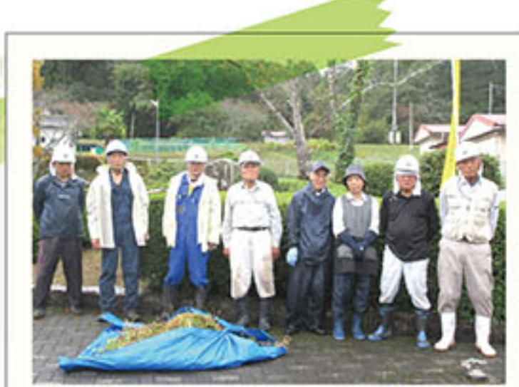
Silver day 2019.10.19 sat