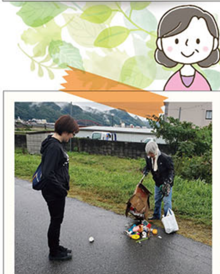
Silver day 2019.10.19 sat