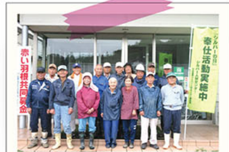
Silver day 2019.10.19 sat