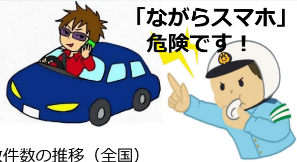
自動車運転時の携帯電話等使用による死亡・重傷事故件数の推移 (全国) (乗用車、貨物車、特殊車)

運転中のスマートフォンの使用や画面注視をきっかけに起きる死亡・重傷事故が増えています。