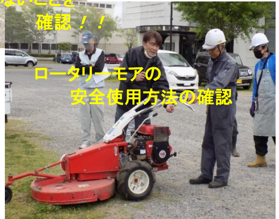
ロータリーモアの安全使用方法の確認