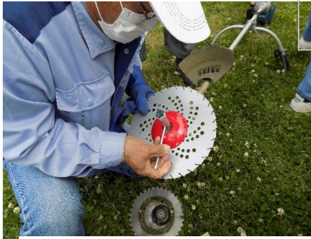
飛び石事故防止策実演