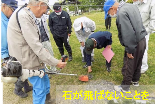
石が飛ばないことを