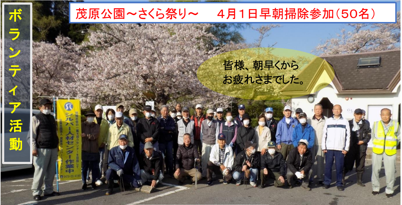
茂原公園～さくら祭り～ 4月1日早朝掃除参加(50名)