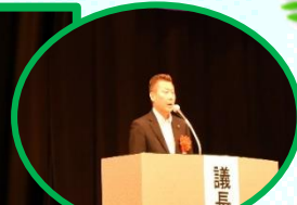
小鍛治市議会議長