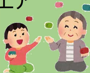
おじやみを作ろう