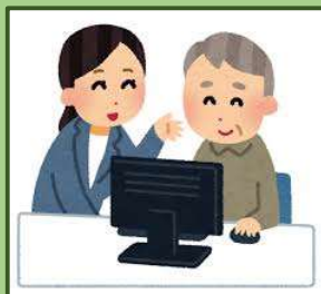
パソコンなんでも相談