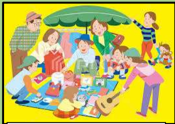
バザー・手作り品販売