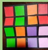
平面ルビックキューブを作ろう