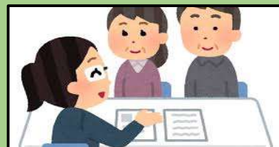
介護・入会相談 女性専用相談コーナーあります