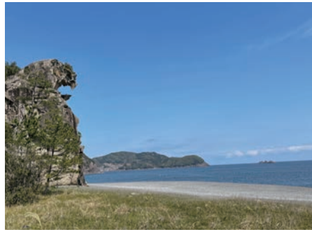
熊野灘に面する獅子岩