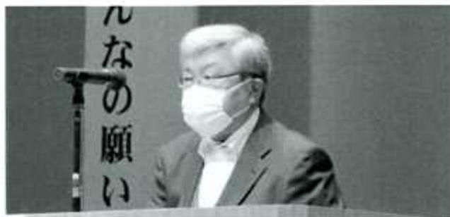
議長を務めた新谷会員