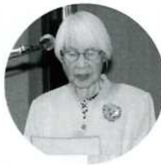
メッセージ披露をする平理事