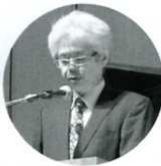
議案説明する高山課長