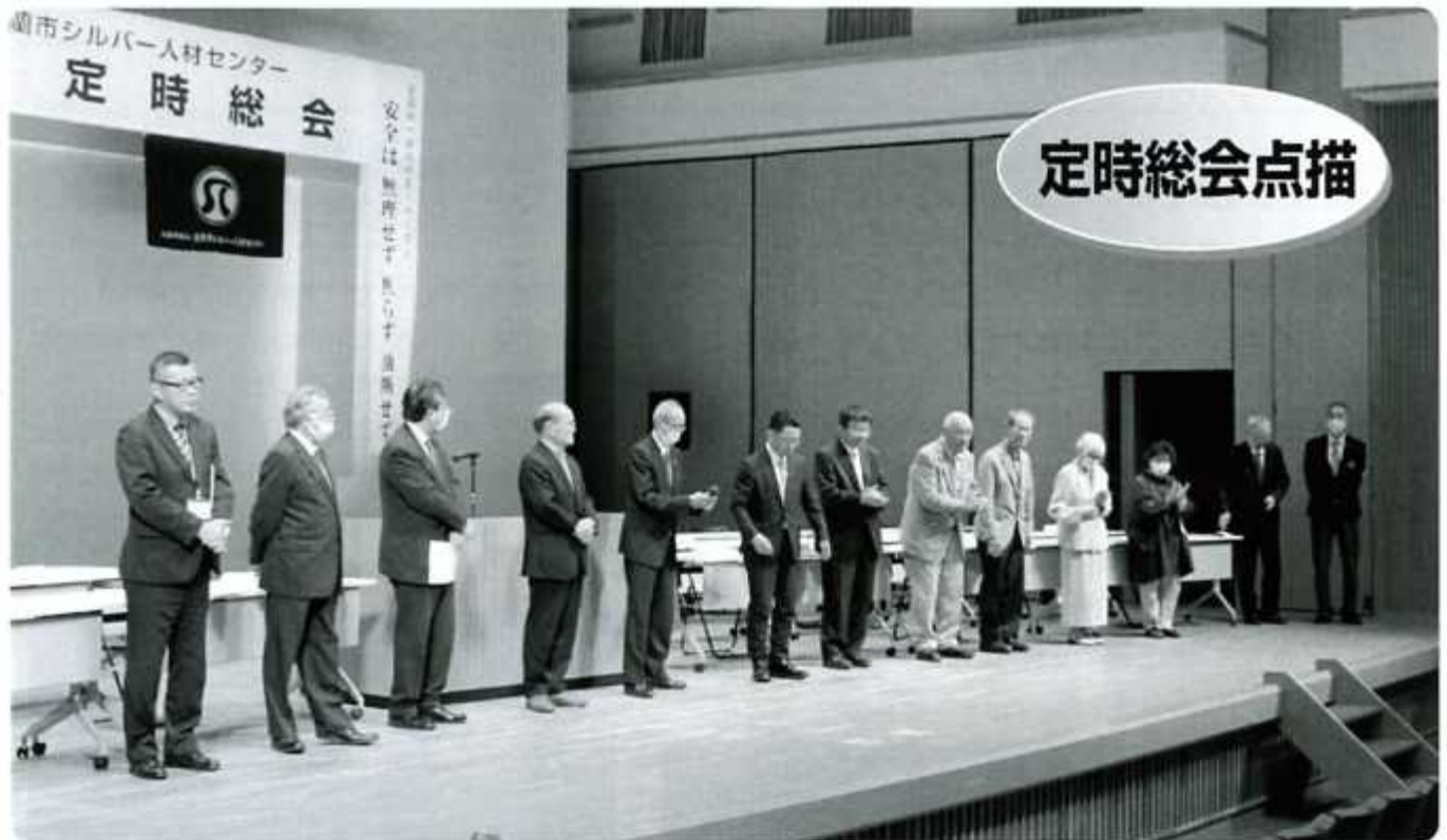
新役員によるご挨拶