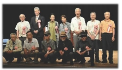
※会員表彰：センターの会員として、センター事業の発展に寄与し、その業績が顕著なもの。77歳を過ぎ、継続して10年以上在籍の方