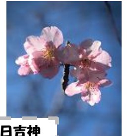
上土狩日吉神社の河津ざくら

🌸 桜堤遊歩道の清掃ボランティアとウォーク (4、12月を除き毎月第3水曜日 2月17日(水)3月17日(水)4月7日(水)9時～シルバー人材センター出発 持ち物:手袋 帽子