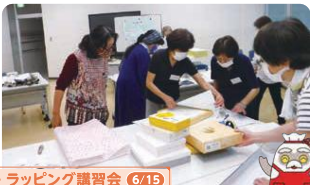
◦ ラッピング講習会 6/15