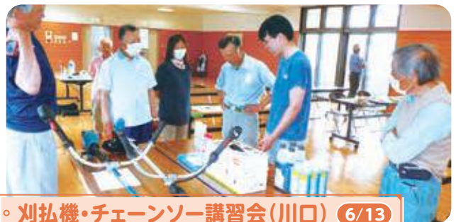
◦ 刈払機・チェーンソー講習会(川口) 6/13