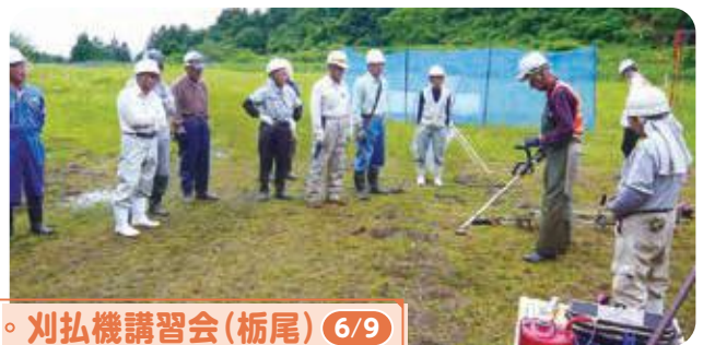
◦ 刈払機講習会(栃尾) 6/9

これから本格的に作業が始まります。安全に留意してケガや事故のないように作業を行いましょう！