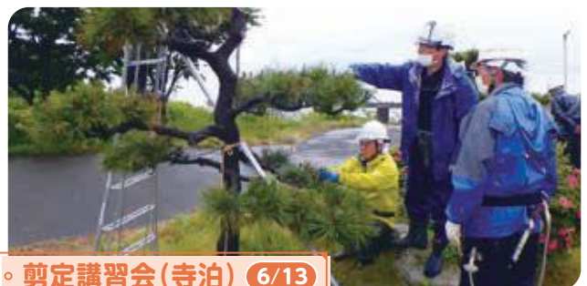
◦ 剪定講習会(寺泊) 6/13